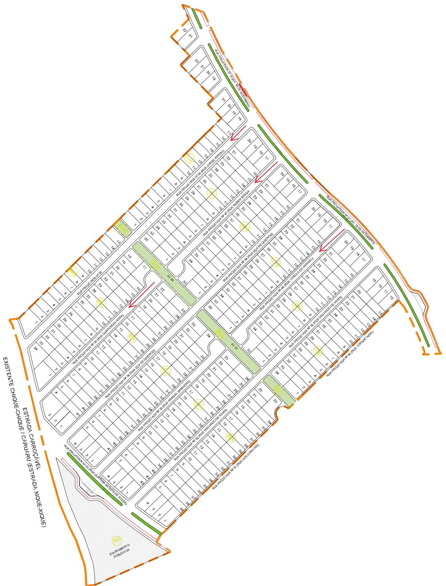
PLANTA DE URBANIZAÇÃO - ETAPA 4 SEM ESCALA