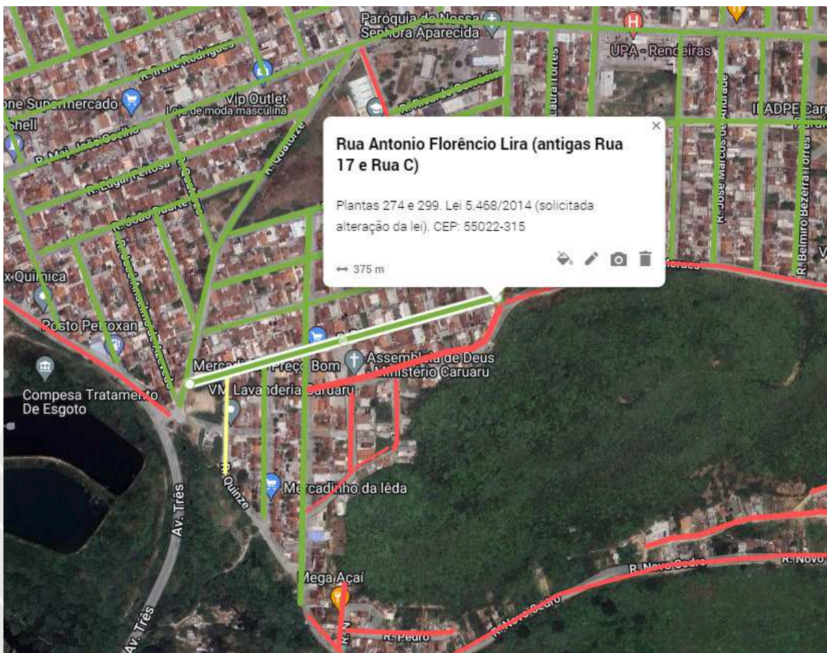
Imagem referente à Rua Antonio Florêncio Lira, localizada no bairro Rendeiras, nesta cidade de Caruaru-PE.

IV. Outrossim, salienta-se que a referida artéria já possui código postal (CEP) sob nº 55022-315 junto a Empresa de Correios e Telégrafos.