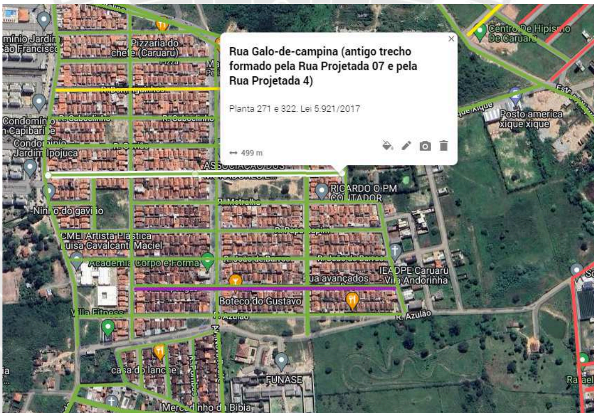
Imagem referente à Rua Galo-de-Campina, localizada no bairro Andorinha, nesta cidade de Caruaru-PE.

III. Segue abaixo a imagem que indica o trecho da RUA GALO-DE-CAMPINA, de acordo com a redação do art. 1º da Lei nº 5.921/2017.