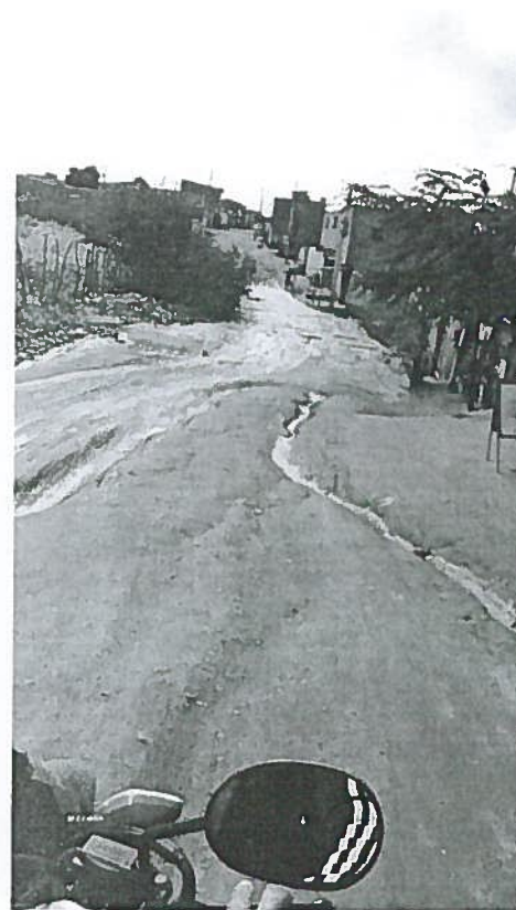
Sala das Sessões, terça-feira, 13 de junho de 2017.