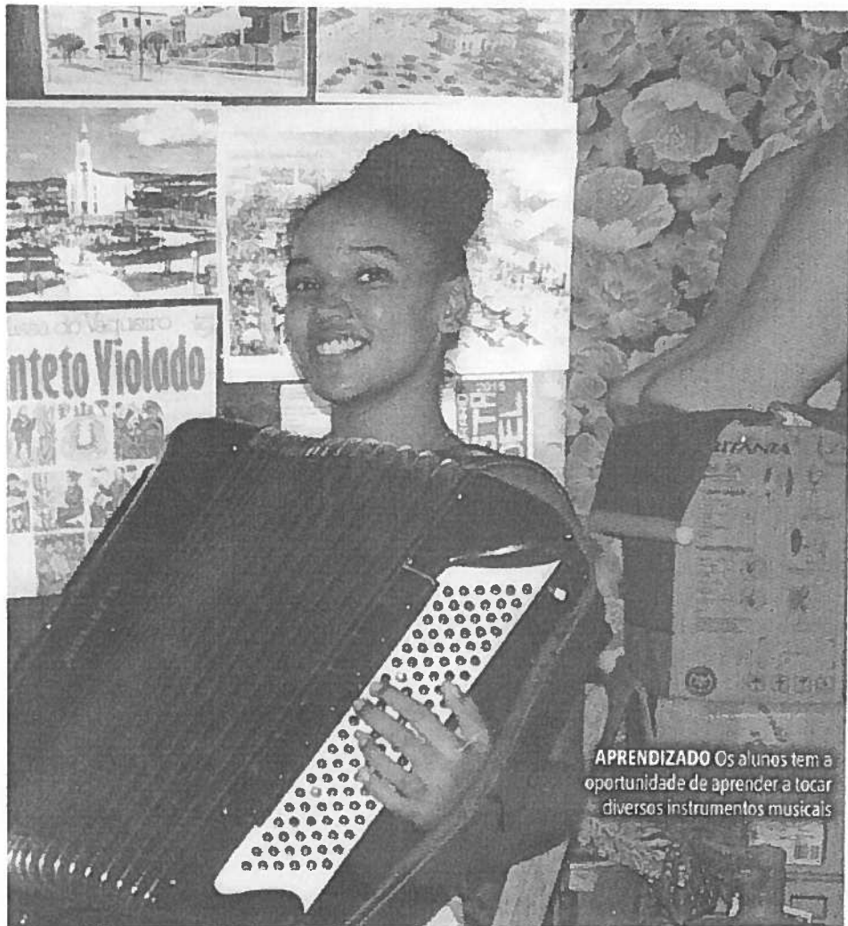
APRENDIZADO Os alunos têm a oportunidade de aprender a tocar diversos instrumentos musicais