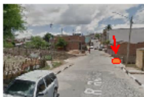
Rua Ribeirão – B. Caiucá

O FATO: A ponte tipo Passagem Molhada, localizada na Rua Ribeirão – B. Caiucá, se encontra muito danificada. A passagem lateral que seria para uso de pedestres está praticamente destruída, obrigando os pedestres a se arriscarem a passar pelo calçamento quando necessitam passar por este trecho da rua. Vale ressaltar que existem várias proposições desta Casa de Leis que solicitam a instalação de redutores de velocidade nesta via, o que reforça a necessidade de uma passagem segura e exclusiva para pedestres nesta rua. Além dos riscos associados à saúde física da população, a situação relatada por meio deste requerimento vem trazendo inúmeros outros prejuízos para a população desta localidade. Neste sentido, existe a necessidade de providenciar, com brevidade, a execução do referido pleito.