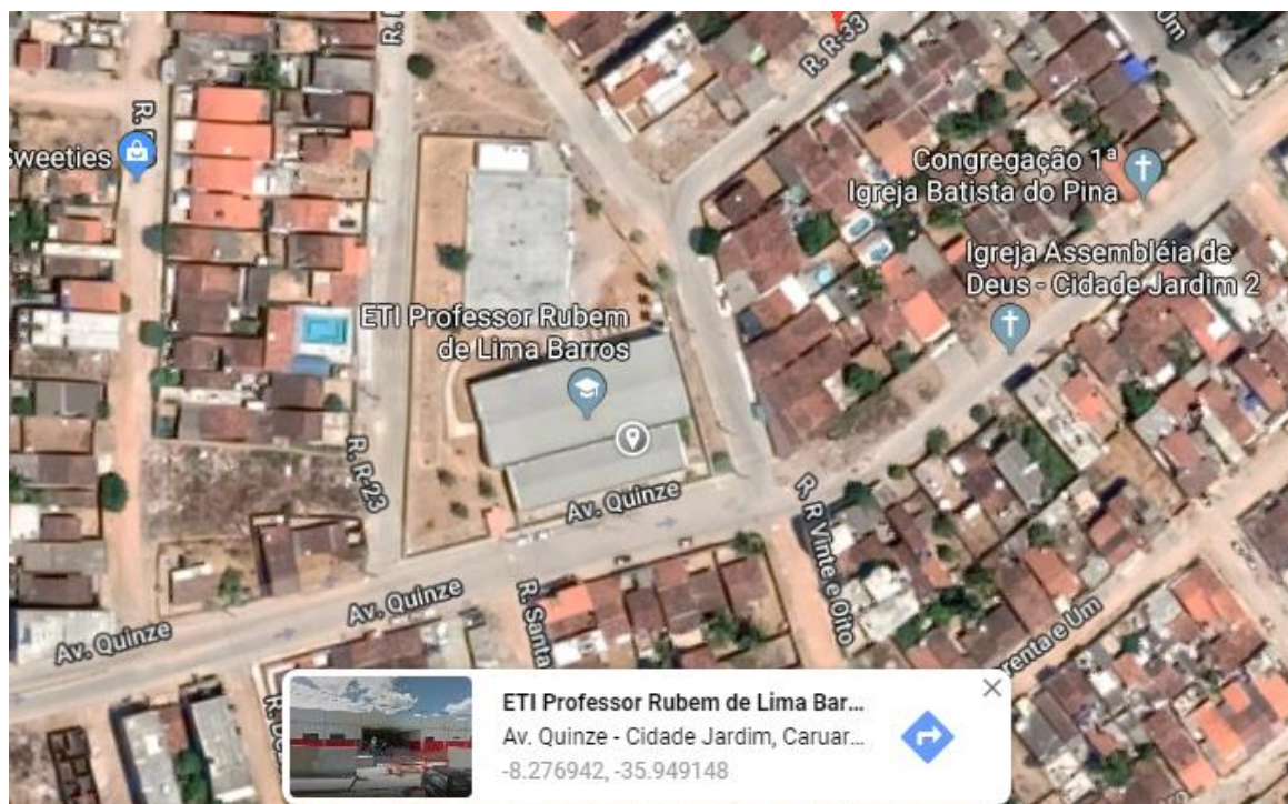
Localização da Escola Municipal Prof.º Rubem de Lima Barros, no Bairro Cidade Jardim.