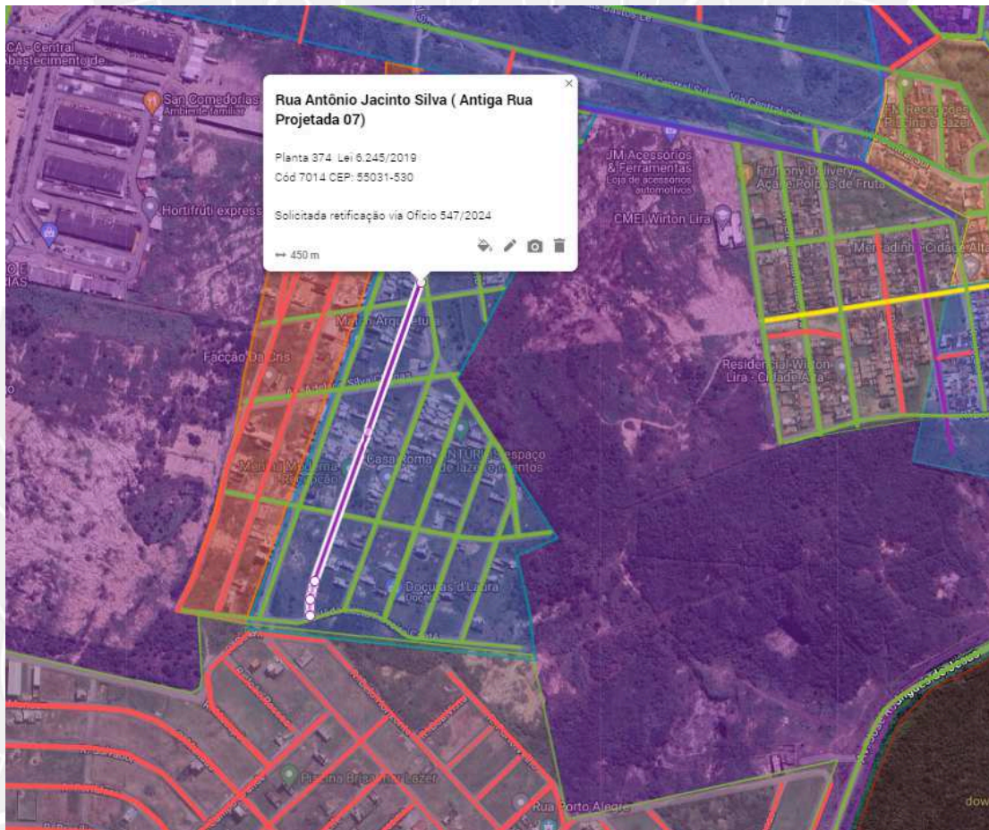
Imagem 01: ilustra exata localização e extensão da Rua Antônio Jacinto Silva , em conformidade com a redação acima indicada.

2) Para auxiliar na identificação geográfica da artéria descrita, segue a Imagem 01 que ilustra a exata localização e extensão da Rua Antônio Jacinto Silva em conformidade com a redação acima indicada.