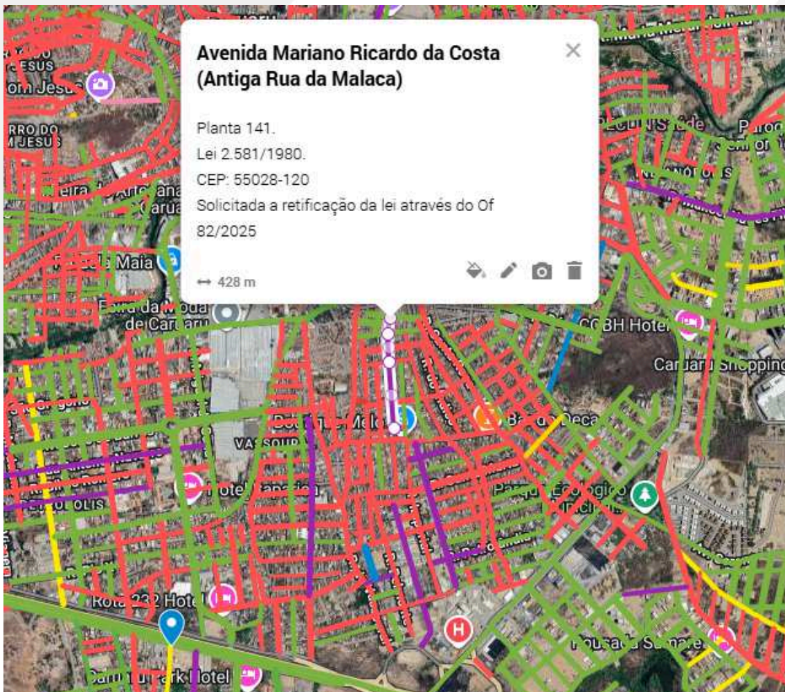
Imagem 04: Localização e extensão da Avenida Mariano Ricardo da Costa , conforme proposta de retificação.

Segue, abaixo, a Imagem 04 que ilustra a localização e a extensão da Avenida Mariano Ricardo da Costa , conforme proposta de retificação.