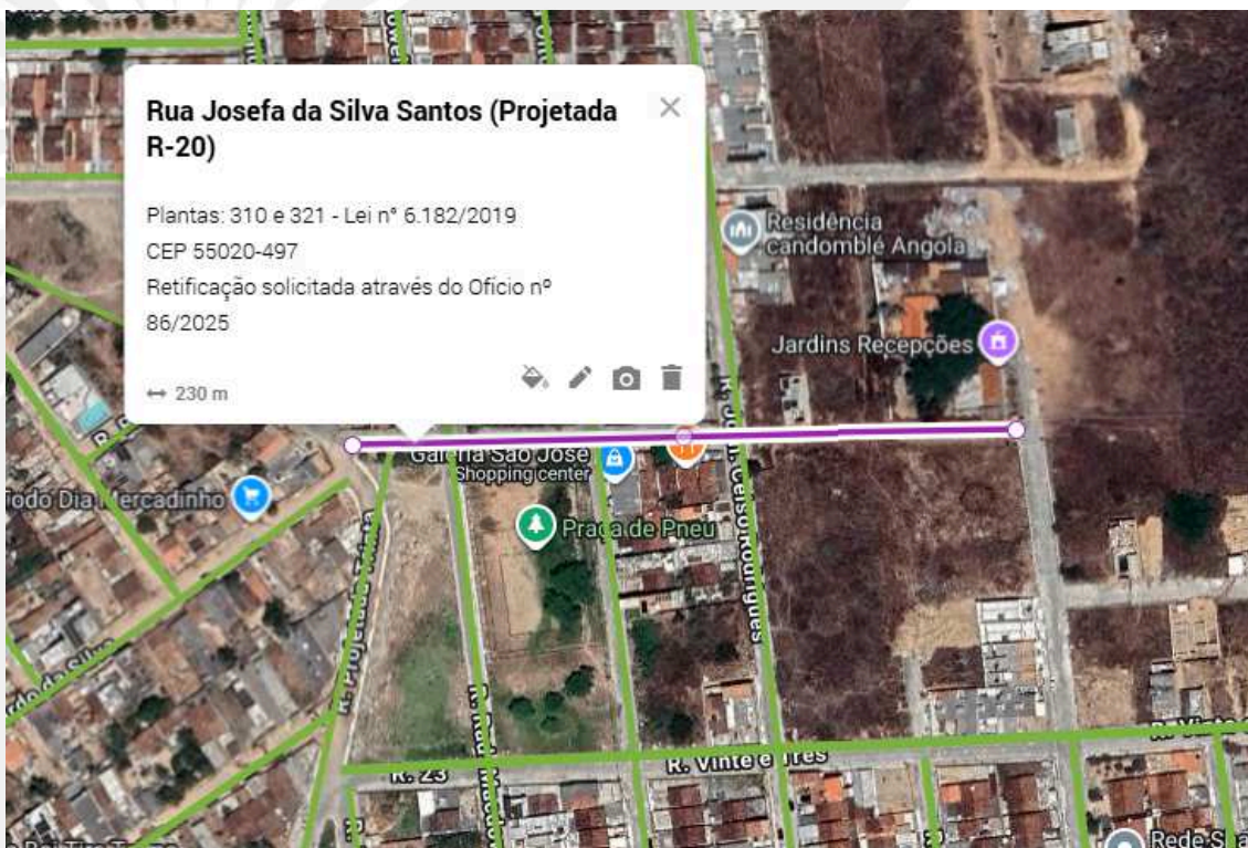
Imagem 02: Localização da artéria em relação aos bairros em que está inserida.

IV) Em síntese, a retificação da norma legal faz-se necessária, para que haja exatidão na determinação de sua extensão, permitindo assim a manutenção de registros e informações corretas dos logradouros existentes neste município. Além disto, o logradouro está cadastrada junto a Empresa Brasileira de Correios e Telégrafos (ECT) com o Código de Endereço Postal (CEP) 55.020-497 que necessita ser atualizado para evitar todo e quaisquer transtornos para a população na prestação de seus serviços logísticos.