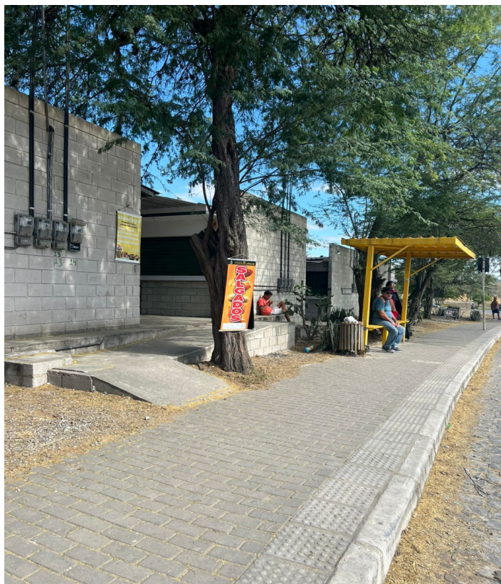
Imagem em Anexo: