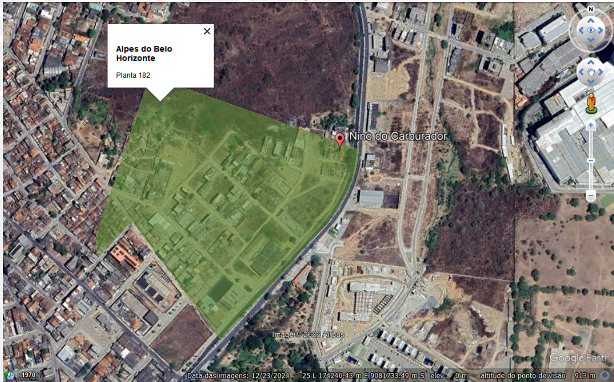
Imagem 01:Loteamento Alpes do Belo Horizonte