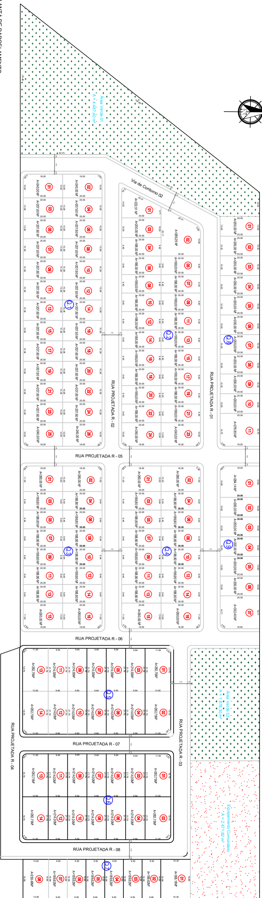
PLANTA DE PARCELAMENTO ESCALA: 1/1000